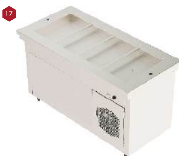
Módulo estufa com gabinete