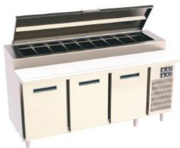
Refrigerador para preparo de pizzas/lanches