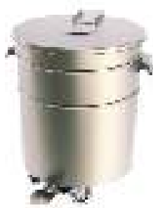
Carro para detritos