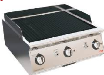
Char broiler a gás