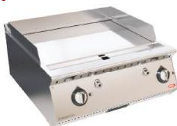
Chapa a gás ou elétrica