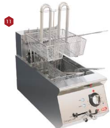
Fritadeira de sobrepor elétrica