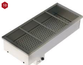
Módulo banho maria

Com módulos neutros, quentes ou refrigerados, a Buffet Line permite soluções adequadas a cada tipo e volume de serviço para distribuição dos alimentos. Linha modular construída em aço inoxidável.