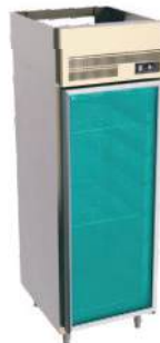
Refrigerador vertical com 1 ou 2 portas inteiriças de vidro