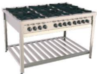
Fogão modular a gás encosto e de centro