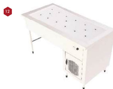
Módulo pista aquecida reta e meia saia