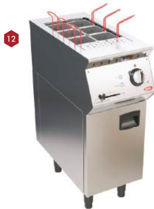
Cozedor de massas a gás ou elétrico