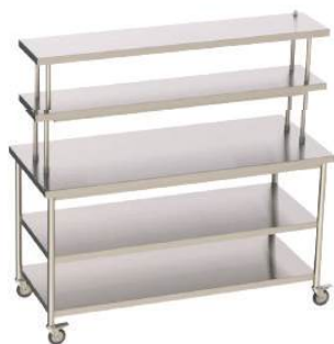
Prateleira superior sobre montantes