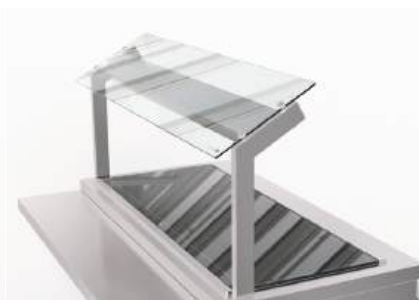
Protetor salivar inclinado