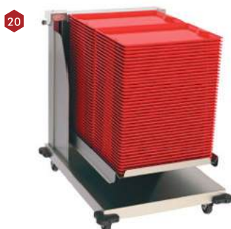
Carro para transporte de bandejas neutro