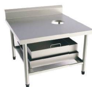
Mesa lisa de encosto para apoio de descascador