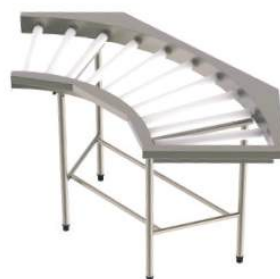
Esteira transportadora de roletes curva