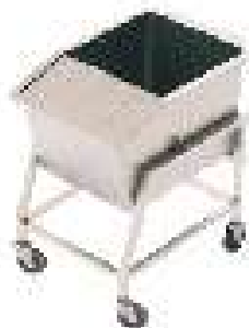
Carro basculante para lavagem e transporte de cereais