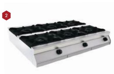
Fogão de centro a gás