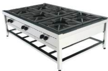
Fogão baixo de centro