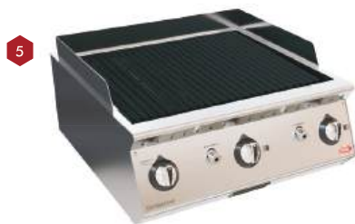
Char broiler a gás