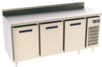
Refrigerador ou freezer horizontal - sem tampo