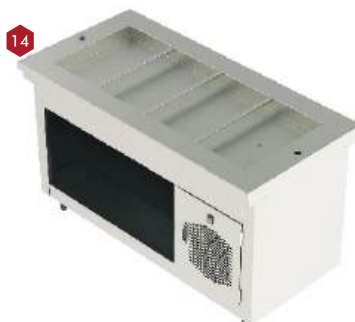
Módulo refrigerado com gabinete inferior