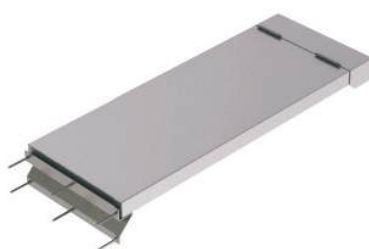
Passagem basculante tipo platibanda