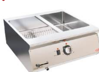
Banho-maria a gás ou elétrico