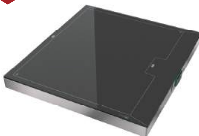
Placa térmica portátil aquecido 2/1 Sobrepor