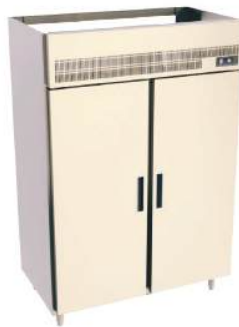
Refrigerador ou Freezer Vertical com 1 ou 2 portas interiças