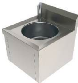
Lavatório para assepsia acionamento joelho