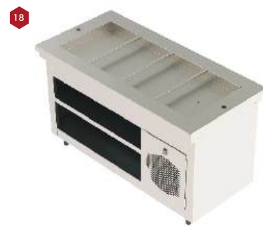
Módulo refrigerado *imagem meramente ilustrativa*