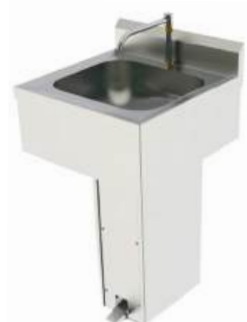
Lavatório para assepsia acionamento pedal