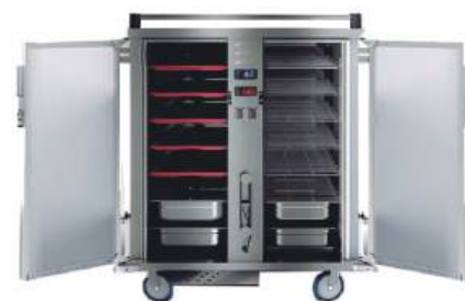
Carro térmico com painel digital aquecido e refrigerado com suporte para gn's ou bandejas