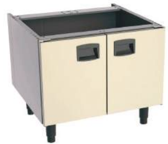
Gabinete base modular