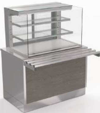
Expositor aquecido e refrigerado grab-n-go