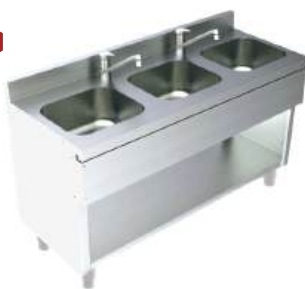
Módulo com 1, 2 ou 3 cubas