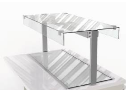
Protetor salivar reto