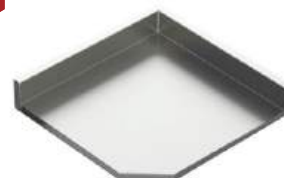
Tampo modular de canto 90° ou 135° com ou sem cuba