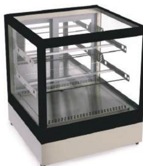
Vitrine sobrepor aquecida, neutra ou refrigerada