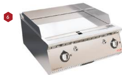
Chapa a gás ou elétrica