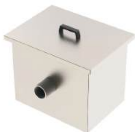
Caixa de gordura