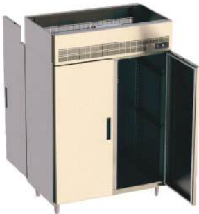
Pass through vertical portas inteiriça, Inox ou vidro