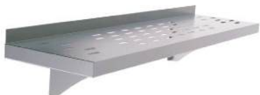
Prateleira superior lisa e perfurada