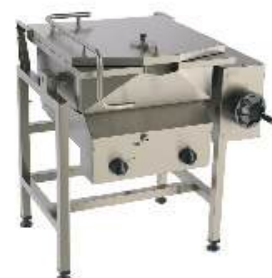
Frigideira basculante a gás ou elétrica comando automático e manual