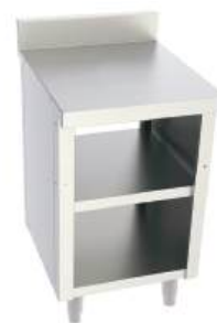
Módulo com prateleiras