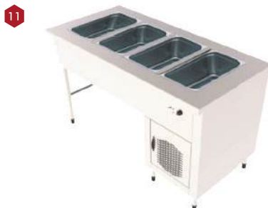
Módulo banho maria meia saia