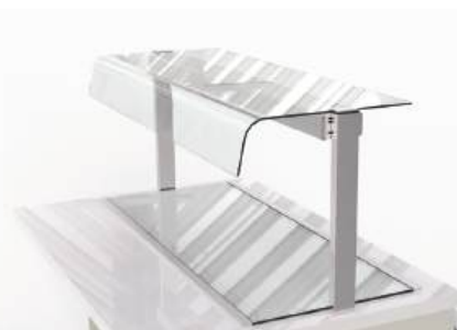
Protetor salivar curvo