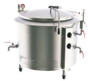
Caldeirão tampa americana