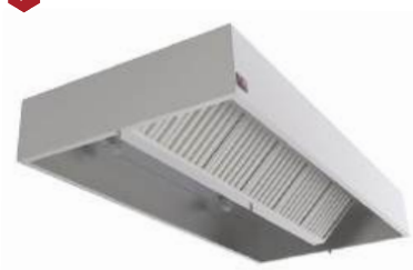
Coifa tipo caixa com e sem Filtro