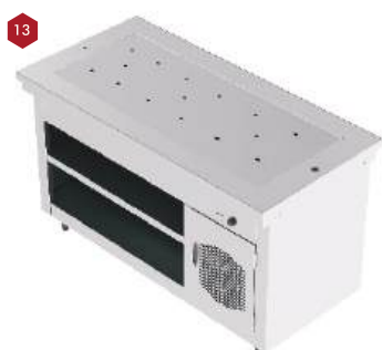
Módulo pista aquecida com gabinete inferior