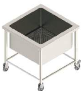
Carro para remolho de talheres