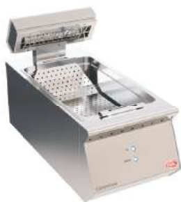
Conservador de frituras elétrico