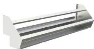
Suporte modular para garrafas simples ou duplo