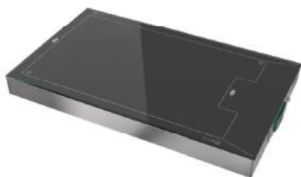
Placa térmica portátil aquecido 1/1 Sobrepor