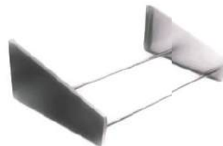
Prateleira tray rest (tubular)