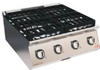
Fogão modular a gás