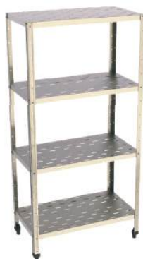
Estante lisa ou perfurada diversos planos