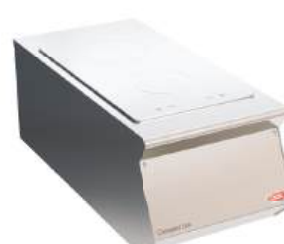
Fogão vitrocerâmico elétrico