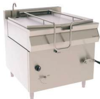
Frigideira basculante gás ou elétrica