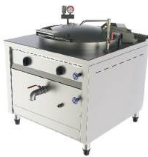
Caldeirão modular industrial