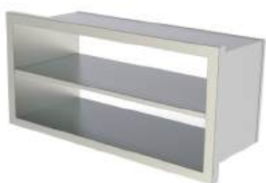
Guichê para devolução de bandejas