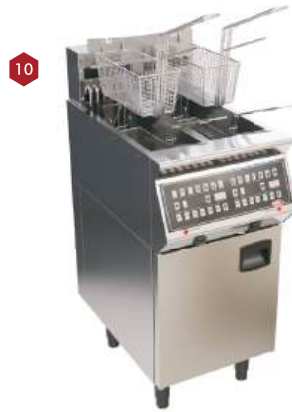
Fritadeira a gás ou elétrica digital