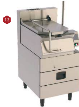
Frigideira basculante manual a gás