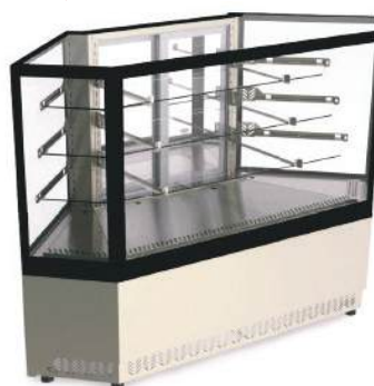
Vitrine canto aquecida, neutra ou refrigerada