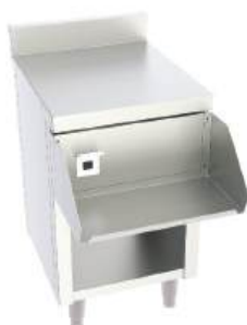
Módulo para liquidificador