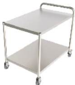
Carro auxiliar 1, 2 ou 3 planos