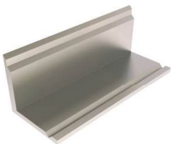
Prateleira tray-rest (lisa)