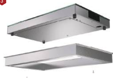
Placa térmica portátil aquecido Moldura de embutimento