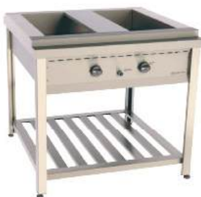
Banho-maria a gás ou elétrico