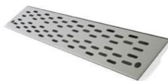
Grelha de piso