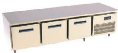
Refrigerador horizontal baixo sem tampo