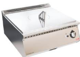
Fogão francês a gás