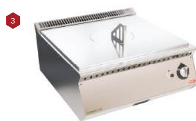
Fogão francês a gás