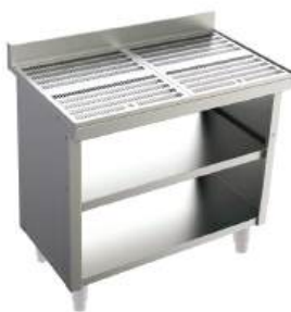
Módulo com escorredor para copos