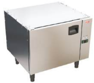
Estufa para pratos modular elétrica