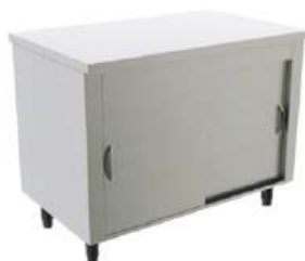
Gabinete inox de encosto ou centro, com ou sem porta