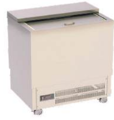
Refrigerador para garrafas ou Freezer para copos