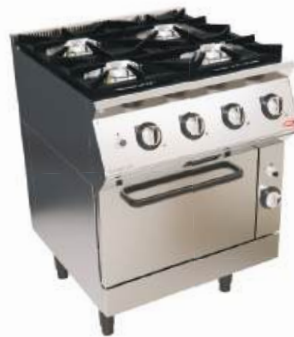
Forno de base a gás ou elétrico