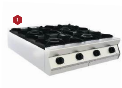
Fogão de encosto

A Power Line é uma linha de equipamentos indicada para cozinhas profissionais que possuem operações de grande demanda, que exigem alto desempenho, robustez e ergonomia. Construída em aço inoxidável, a linha é composta por modernos equipamentos e acessórios destinados à produção de grelhados, massas, frituras e cocções em geral com grande quantidade de alimentos.