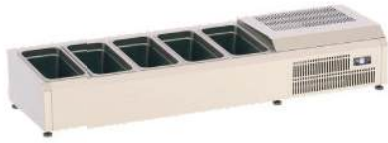
Cabeçote refrigerado com motor incorporado de sobrepor