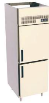
Refrigerador ou Freezer Vertical com 2 ou 4 portas bipartidas