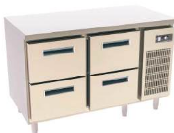
Refrigerador horizontal com gavetas, sem tampo