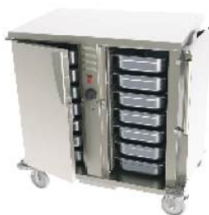
Carro térmico aquecido ou neutro com suporte para gn's ou bandejas