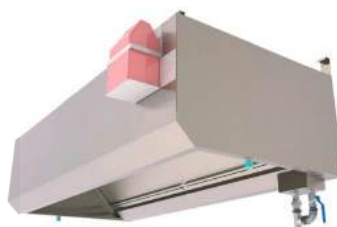
Coifa inteligente com sistema de lavagem automática.