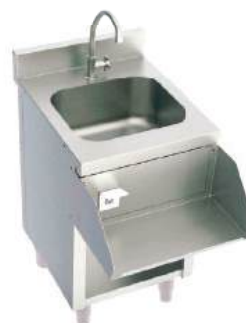
Módulo com cuba e suporte para liquidificador