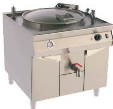
Caldeirão a gás autogerador de vapor