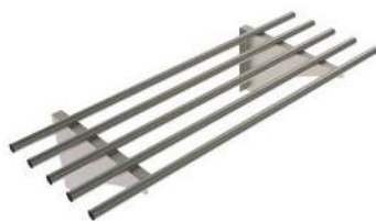
Prateleira superior tubular