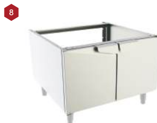
Gabinete base modular