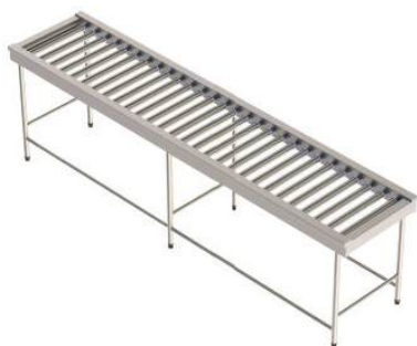
Esteira transportadora de roletes