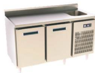
Refrigerador para barras de chopp sem tampo