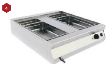
Banho-maria a gás ou elétrico