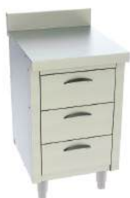
Módulo com gavetas