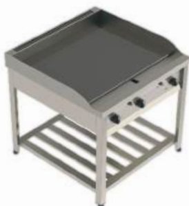
Chapa a gás ou elétrica