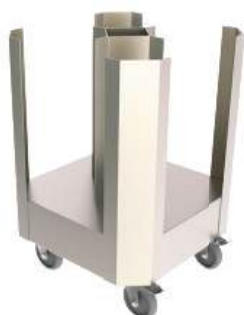
Carro para transporte de pratos