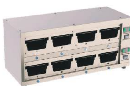
Conservador de proteínas