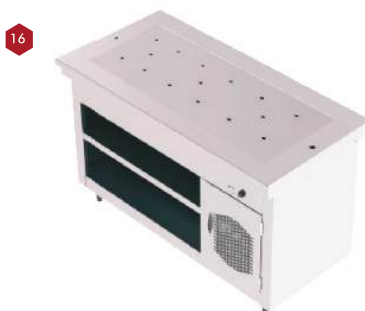
Módulo pista aquecida reta