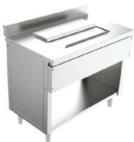
Módulo cuba de gelo