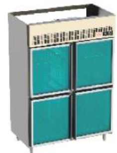
Refrigerador vertical com 2 ou 4 portas bipartidas de vidro