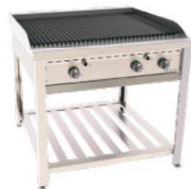
Char broiler a gás