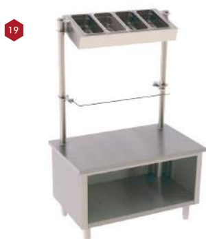
Módulo para pães, talheres e pratos