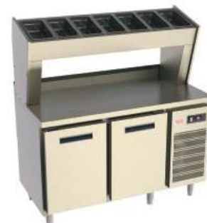
* Cabeçote Refrigerado Suspenso