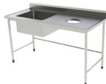
Mesa com cuba e furo para detritos