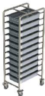
Carro cantoneira para transporte de gn's