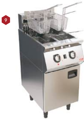
Fritadeira a gás ou elétrica painel analógico