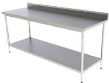
Mesa lisa de encosto ou centro opcional: prateleira inferior/superior