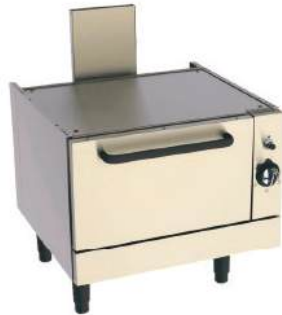
Forno de base modular a gás ou elétrico