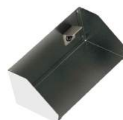
Suporte modular para liquidificador