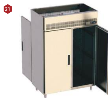
Pass through vertical aquecido