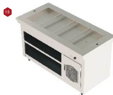
Módulo banho maria *imagem meramente ilustrativa*