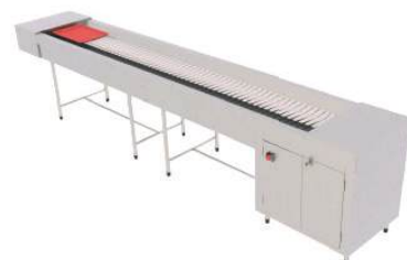
Esteira transportadora para pratos e bandejas