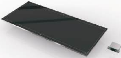
Placa térmica Plug-In Aquecido