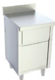
Módulo com lixeira e tampa basculante