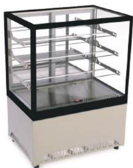
Vitrine alta aquecida, neutra ou refrigerada