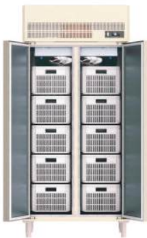
Mini câmara vertical para resfriamento/congelamento