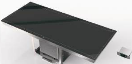
Placa térmica Plug-in refrigerado