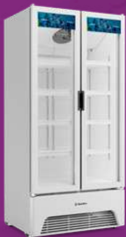
VB70AL Optima 752L