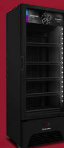
VF50AH All Black 581L