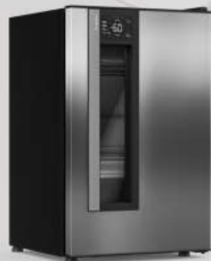
VN12 Beer Maxx One Inox 114L