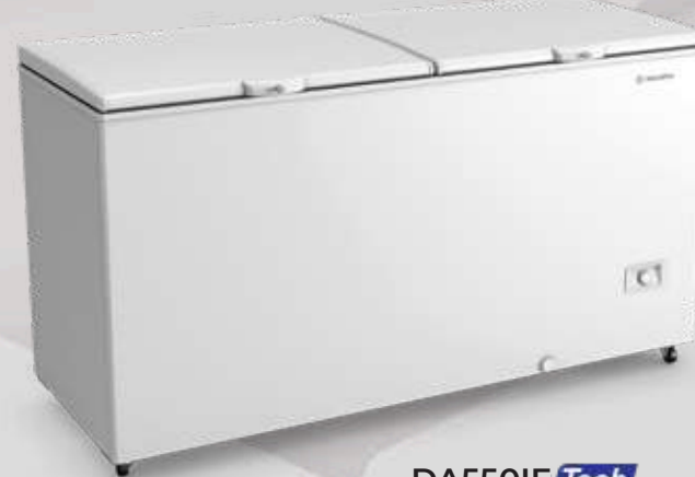
DA550IF Tech 543L