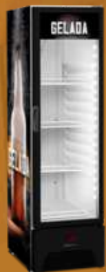
VN28RP Cerveja Gelada 336L