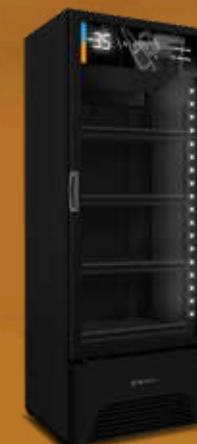
VN50AH All Black 576L