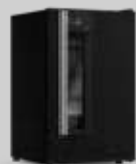
VN12 Beer Maxx One Preto Onix