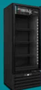
VF55AH All Black