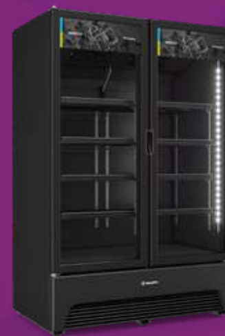
VBM3AH All Black 1.257L