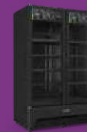
VBM3AH All Black