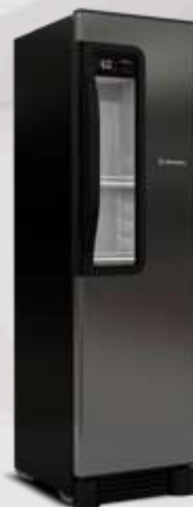
VN28 Beer Maxx Inox 336L