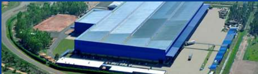
📍 Polo Industrial Três Lagoas - Mato Grosso do Sul