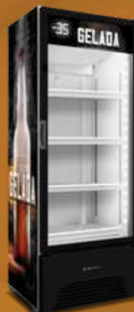
VN50AH Cerveja Gelada 576L