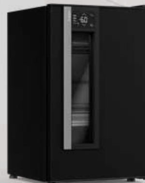
VN12 Beer Maxx One Preto Onix 114L