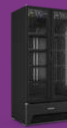
VB70AH All Black