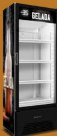
VN44AH Cerveja Gelada 435L