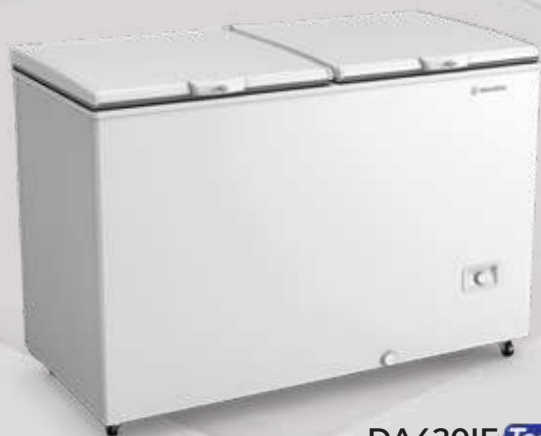
DA420IF Tech 417L