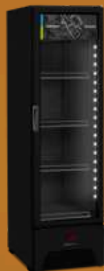
VN28RH All Black 336L