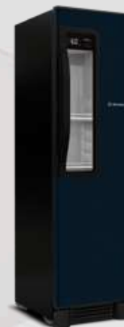
VN28 Beer Maxx Azul Grafite 336L