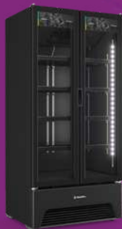
VB70AH All Black 752L