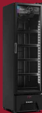
VF28AH All Black* 337L