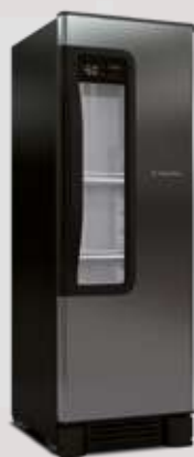
VN25 Beer Maxx Inox 264L