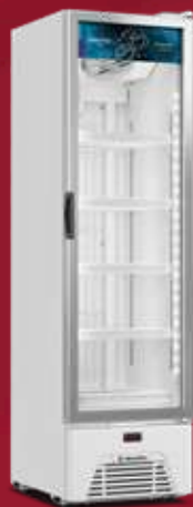
VF28AH Optima* 337L