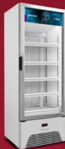
VF50AH Optima 581L