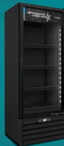
VF55AH All Black 531L