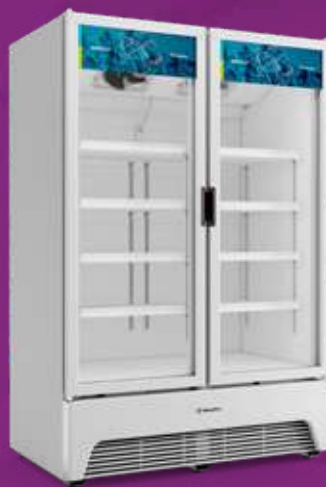
VBM3AL Optima 1.257L