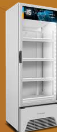
VN50AH Optima 576L