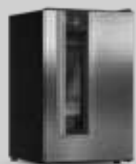
VN12 Beer Maxx One Inox